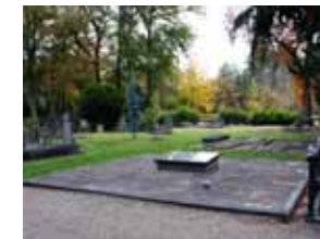
Plaatjes van 't Groenedael

king stelde van de zusters van het St. Catherinaconvent. Voorts pachtte hij een stuk grond tussen de Esche en de Hagen en liet daarop een nonnenklooster bouwen. In de loop van de tijd kreeg het klooster de beschikking over verschillende erven (uiteindelijk 29 stuks) in Borne, Enter, Enschede, Hengelo en Rijssen. Met de Reformatie kwam aan de geschiedenis van het eerste Sint Cathrijneklooster een einde en daarmee officieel aan het katholicisme in de heerlijkheid Almelo. In 1880 legde de pastoor van de St. Georgiusparochie de eerste steen voor het nieuwe St. Catharinaklooster aan de Boddenstraat.