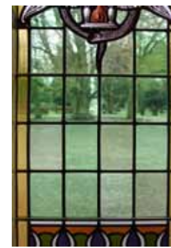
Gezicht op de oude rode beuk vanuit het stiltecentrum bij de oorspronkelijke ingang.

Behalve fabrieken en villa's bezaten de Almeloze textielfabrikanten ook veel landbouwgrond in de omgeving. Net als elders belegden ze geld in bijvoorbeeld heidegronden die in de loop van de negentiende eeuw voor verkoop beschikbaar kwamen als gevolg van het ontbinden van de marken. Onder andere in de Aaldrinkshoek ten zuidoosten van de stad bezaten de Ten Cates, de Salomons en Van Rechteren Limpurgs veel landbouwgrond. Hier kwam de algemene begraafplaats 't Groenedael tot ontwikkeling. In 1900 was het een begraafplaats van bescheiden omvang. In de loop van de twintigste eeuw groeide deze uit tot één van de grotere van Overijssel.