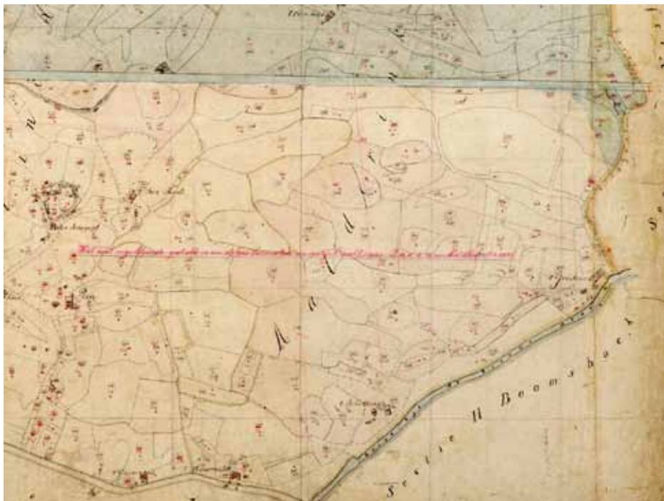
De Aalderinkshoek op de kadastrale minuutplan van 1832. De bijbehorende Oorspronkelijk Aanwijzende Tafel laat per perceel zien wie de eigenaar was, wat zijn beroep was, of het bouwland, weiland, hooiland of woeste grond was, oppervlakte van het perceel en in welk belastingtarief het viel. Eén van de bladzijden uit de OAT staat in dit boekje.

De ligging van de stad Almelo aan bevaarbare beken, die aansloten op de vaarroutes naar Zwolle en Deventer, maakte Almelo in de Middeleeuwen tot een belangrijke overslaghaven in het goederenvervoer tussen Twente en Zwolle. Als haven deed de benedenkolk van de watermolens van het Huis Almelo dienst. Hier bevond zich ook een kraan voor het laden en lossen van de zompen en potten. Almelo groeide uit tot het belangrijkste Twentse schipperscentrum met in 1674 14 beroepsschippers en in 1746 al meer dan twintig. In de loop van de achttiende eeuw werd Enter de belangrijkste Twentse doorvoerhaven. Tot de belangrijkste handelsprodukten van de vele Almelse handelaren behoorden bombazijn (een stof bestaande uit een linnen ketting met een katoenen inslag), laken (geweven