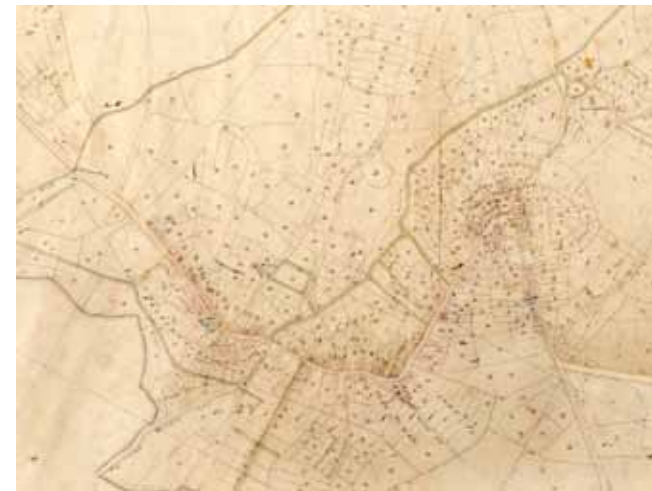
Goor op de kadastrale minuutplan uit 1832.

Aangezien voor de fijne garens de kettingdraden gesterkt moesten worden, betrok men deze aanvankelijk kant en klaar uit Engeland. Ainsworth liet echter voor eigen rekening een sterkmachine in Goor opstellen en verbond aan deze sterkerij, met financiële steun van de N.H.N. een inrichting voor het afwinden en scheren van de kettingen. Ook de sterkerij was bedoeld als modelfabriek. In 1837 werd ook deze sterkerij verhuisd naar Nijverdal. In overleg met de Nederlandsche Handel Maatschappij werd besloten in het ontruimde gebouw van de voormalige sterkerij een stoomblekerij in te richten. Deze ging nog in hetzelfde jaar onder de naam Firma Ainsworth & Buechler van start. De benodigde machines werden uit vrees voor concurrentie uit Engeland naar Nederland gesmokkeld. Terwijl de kleine kunstblekerijtjes de stoom uitsluitend gebruikten voor koken en drogen, dreef Ainsworth zijn machines aan door een verticale stoommachine. Veel Twentse weverijen lieten hun doek in Goor bleken. Na de dood van Thomas Ainsworth in 1841 kwam de stoomblekerij in 1857 uiteindelijk in handen van een combinatie van Twentse fabrikanten en ontstond de N.V. Twentsche Stoomblekerij met 41 deelnemers.