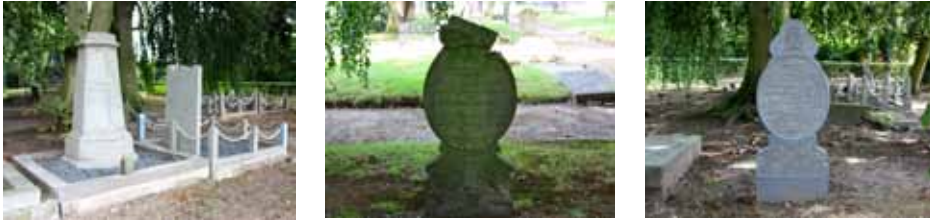
Plaatjes van voor en na de opknapbeurt.