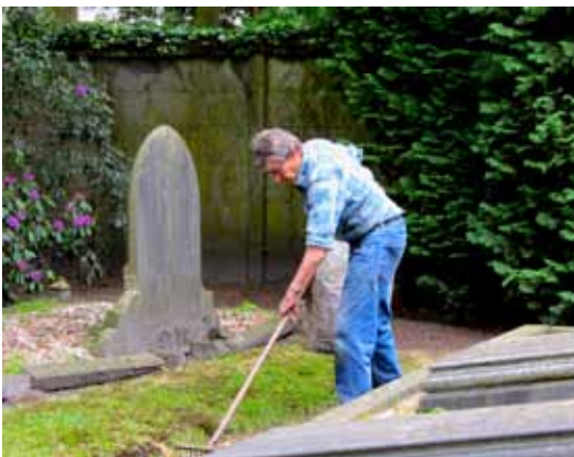
Vol trots en met toewijding onderhoudt een tuinman de begraafplaats aan de Spoorstraat.