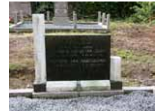
Plaatjes van voor en na de opknapbeurt.