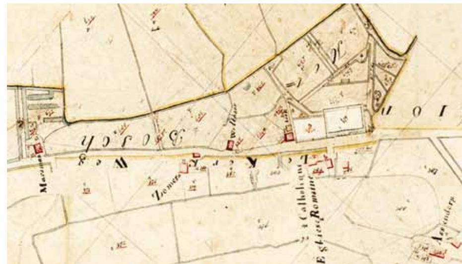
Het Heemkerkhof op de kadastrale minuutplan uit 1832. Het kadastrale nummer van het kerkhof was toen 679.

Het kerkhof 'op den Heemen' lag vroeger bij een schuurkerk. Deze bevond zich aan de overzijde van de weg. In 1834 brandde de kerk volledig af, precies een week nadat er op hetzelfde tijdstip ook al een brand had gewoed. Totdat in november 1837 in het dorp een nieuwe waterstaatskerk in gebruik werd genomen, kerkten de Raalternaren voorlopig in een schuur in het dorp. Het waterstaatskerkje was de voorganger van de huidige katholieke kerk in Raalte. De laatste begrafenis op het Heemkerkhof was eind negentiende eeuw. Het Heemkerkhof raakte daarna in verval en werd overwoekerd door bomen en struiken.