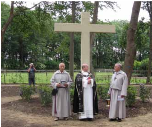
Op zaterdag 2 juni 2012 werd het volledig opgeknapte Heemkerkhof opnieuw ingezegend door de pastoor van de parochie Raalte. Hij had zich speciaal voor die gelegenheid gestoken in een 150 jaar oude kazuivel.

Het heemkerkhof ligt iets ten oosten van de oude kern van Raalte in een streek die eeuwenlang Assendorp heette. Op de kadastrale kaart uit 1832 staat ook een boerderij ingetekend met die naam. Deze was van Roelof Assendorp uit Tijenraan die hier zijn gemengde landbouwbedrijf uitoefende. Zijn boerderij en de begraafplaats lagen in het zuiden van het dorpsgebied van het gehucht Tijenraan. Op te topografische kaart uit ca 1900 staat de begraafplaats nog wel aangeven, die Heemkerk niet meer. Logisch, want deze was in 1834 afgebrand en is later niet meer opgebouwd. De geschiedenis van het Heemkerkhof is nauw verbonden met die van het naburige Mariënheem, het jongste dorp van de gemeente Raalte. Mariënheem is in 1937 ontstaan, ten oosten van Raalte aan de weg naar Nijverdal. In dat jaar werd de gelijknamige parochie gesticht en werd begonnen met de bouw van een kerk vlakbij de enkele jaren eerder gebouwde school. De parochie en de buurschap ontvingen daarbij de naam Mariënheem, dit in tegenstelling tot de wens van de burgemeester die voorgesteld had de buurt Assendorp te noemen, zoals deze buurt vroeger heette. De naam van deze nederzetting is deels ontleend aan de naam van de schuurkerk die vroeger heeft gestaan bij de plaats waar nu nog het oude kerkhof ligt, namelijk de 'kerk op de hemen'. Het eerste gedeelte van de plaatsnaam is ontleend aan de naam van de nieuwe parochie 'Onze Lieve Vrouwe'.