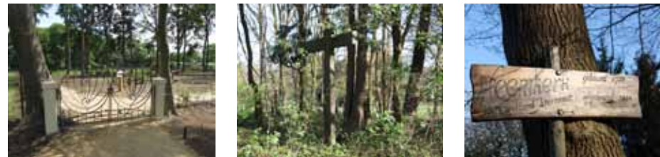
Plaatjes van voor en na de restauratie