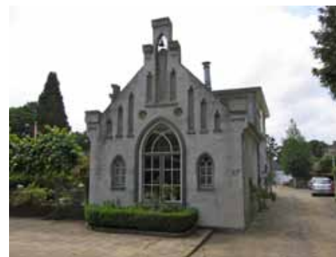
Het begraafplaatshuisje bij de ingang van de begraafplaats.