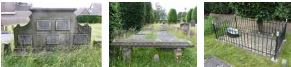
Links de grafsteen van het familiegraf van Bakhuis, midden het bankje met de leeuwen bij de begraafplaats van de adellijke families en rechts het graf met een graftrommel.

Hoewel de Oude Olster begraafplaats vanaf 1924 in gebruik bleef, nam het aantal bijzettingen zeer sterk af en werd het beheer en onderhoud navenant minder. Eind twintigste eeuw was de begraafplaats grotendeels overwoekerd door allerlei soorten grassen, struiken en onkruid en waren veel grafmonumenten scheef gezakt, verzakt of gebroken. Een aantal Olstenaren trok zich het lot van de begraafplaats aan en richtte in 2000 een werkgroep op voor het behoud en herstel. De staat waarin de Oude Olster begraafplaats anno 2012 verkeerd is het resultaat van een grote opknappbeurt uitgevoerd in het kader van het project 'Historische begraafplaatsen in cultuurhistorisch perspectief'. Steen en ijzer op de begraafplaats zijn flink onderhanden genomen. Gebroken grafstenen zijn hersteld en smeedijzeren hekjes zijn waar nodig opgeknapt en voorzien van een nieuwe beschermende verflaag. Het aanwezige groen wordt al jaren met beleid gesnoeid en geknipt. Verschraling staat daarbij op de eerste plaats. Door maar twee keer per jaar op gezette tijden te maaien en het maaisel af te voeren neemt de soorten- en kleurenrijkdom enorm toe. Blikvangers van de Oude Olster begraafplaats zijn, naast de fraaie toegangspoort met lelietjes van dalen, de grote zuil op het familiegraf van Bakhuis, een prachtige stenen rustbank met standers in de vorm van leeuwen bij de plek van de adellijke graven en het mooi gerestaureerde graf met daarop de enige, ook gerestaureerde, graftrommel.