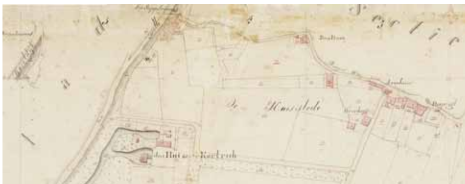
De Oude Olster begraafplaats op de kadastrale minuutplan van 1832.

De Oude Olster begraafplaats ligt als een oase van rust verscholen tussen de huizen van een kleine woonbuurt vlakbij de IJsseldijk. Een prachtig gerestaureerd smeedijzeren hek is de enige toegang. Vanaf 1 februari 1832 vonden hier Olsternaren hun laatste rustplaats, de gewone man in het oudste zuidelijke deel en de meer welgestelden in het noordelijke deel. Het zuidelijke deel lijkt leeg, maar hier liggen nog wel mensen begraven. Alleen zijn hun weinig duurzame zerken inmiddels allang vergaan en verdwenen. Tot 1829 was het gebruikelijk de doden te begraven in de kerk, maar daarna mocht dat niet meer, onder meer uit oogpunt van de volksgezondheid. Voortaan mocht er alleen nog worden begraven buiten de bebouwde kom. Op de kadastrale minuutplan uit 1832 staat de