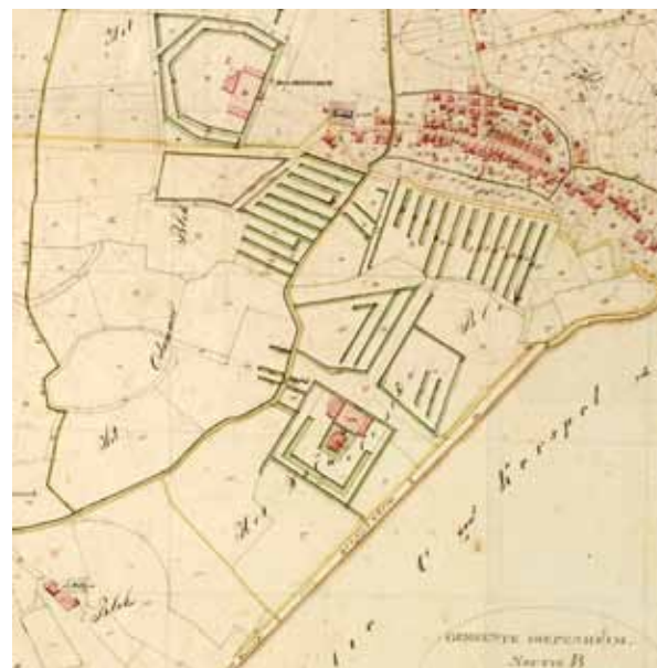
De Oude Algemene Begraafplaats en de Nieuwe Algemene Begraafplaats van Diepenheim op de kadastrale minuutplan van 1832.

Alleen een hek in een heg aan de Odammerweg vlakbij Huis te Diepenheim en het Warmelo verradt de aanwezigheid van de oude algemene begraafplaats van het Twentse Diepenheim. Net als op vele andere oude begraafplaatsen is ook hier een grafmonument in de vorm van een afgebroken zuil te vinden. Deze staat symbool voor de eindigheid van het leven. Blikvangers op de begraafplaats zijn drie uit de kluiten gewassen coniferen. Het grootste graf is van de adellijke familie Schimmelpenninck. Leden van die familie spelen van oudsher een belangrijke rol in de landelijke en regionale politiek.