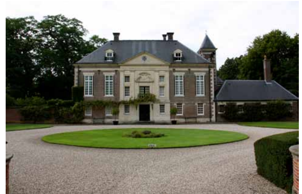
Huis Diepenheim: een belangrijke spil in de geschiedenis van de streek waarin de algemene begraafplaatsen van Diepenheim een plek kregen.

Wanneer Diepenheim is ontstaan en wanneer deze nederzetting stadsrechten heeft gekregen is onbekend. De naam Diepenheim wordt op twee manieren verklaard. Volgens sommige historici betekent de naam eenvoudig 'laag gelegen heim of woonplaats', anderen menen dat Diepenheim niet meer en niet minder dan 'woonstede van ene Thiëpo of Dippo' betekent. Het ontstaan van de huidige nederzetting, die gerekend wordt tot de acht steden van Twente, heeft vermoedelijk in drie en vrijwel zeker in twee fasen plaatsgevonden. Doorslaggevende vestigingsplaatsfactoren waren steeds natuurlijke omstandigheden die het bouwen van een versterking mogelijk maakten. Twee belangrijke riviertjes waren van levensbelang voor Diepenveen: de Scheepbeek en de Regge.