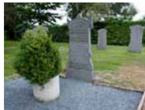
Plaatjes van voor en na de restauratie

Hieronder staan 7 bijzondere plekken op de begraafplaats. De kaart achterin het boekje laat zien waar deze liggen. Loop gerust van de ene naar de andere bijzonder plek, maar wel met respect voor de plek.